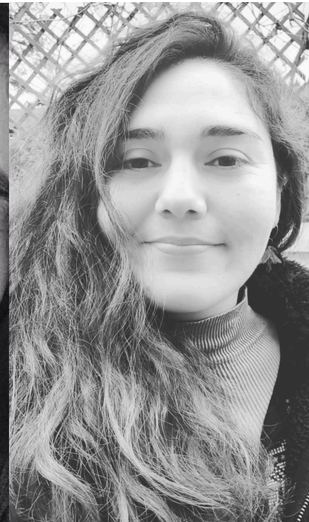
Scarlet Palma Taller de Cosmética Natural.